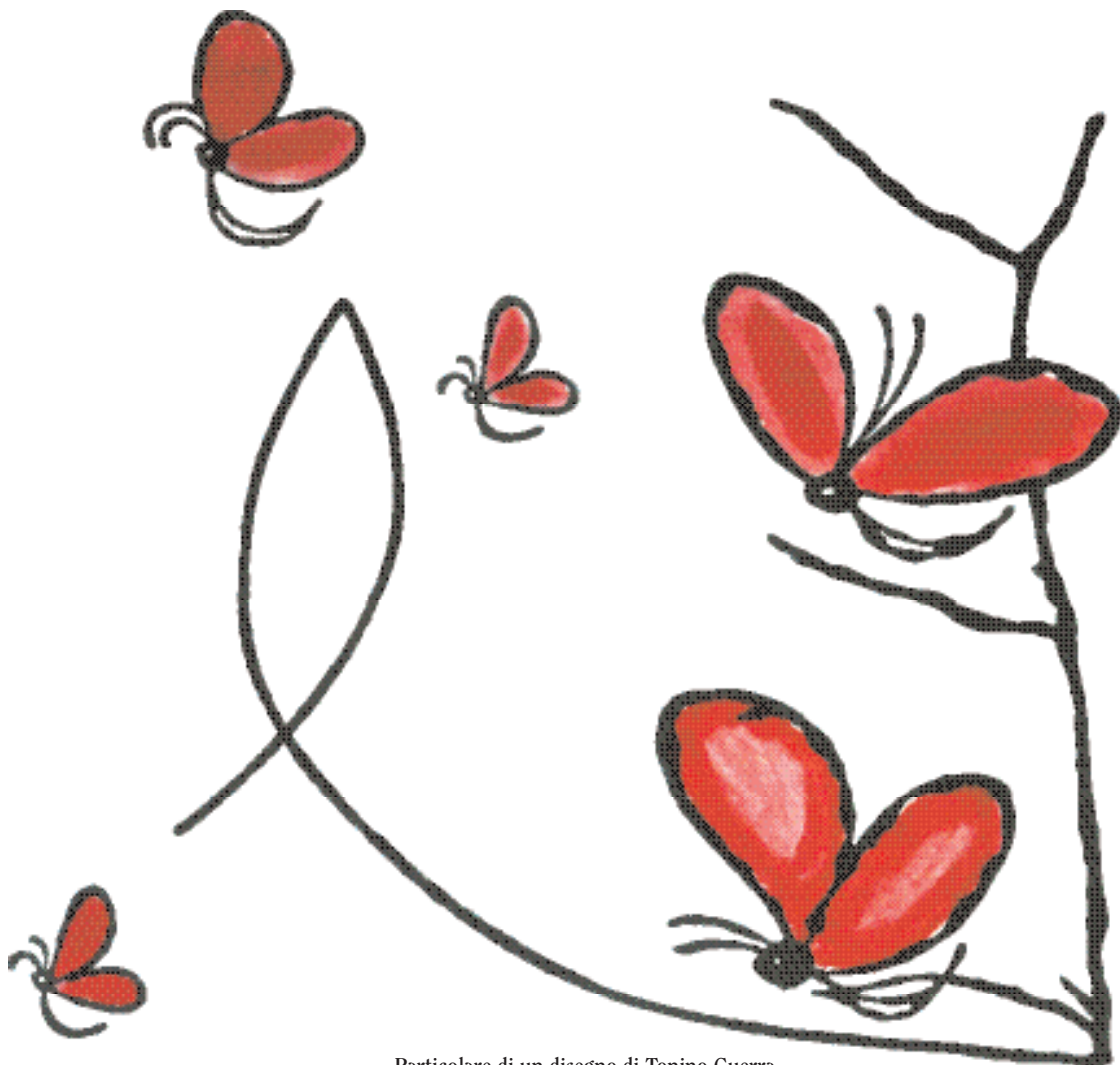
Particolare di un disegno di Tonino Guerra

Sede: Palazzo dei Congressi Via della Fiera, 23 - Rimini